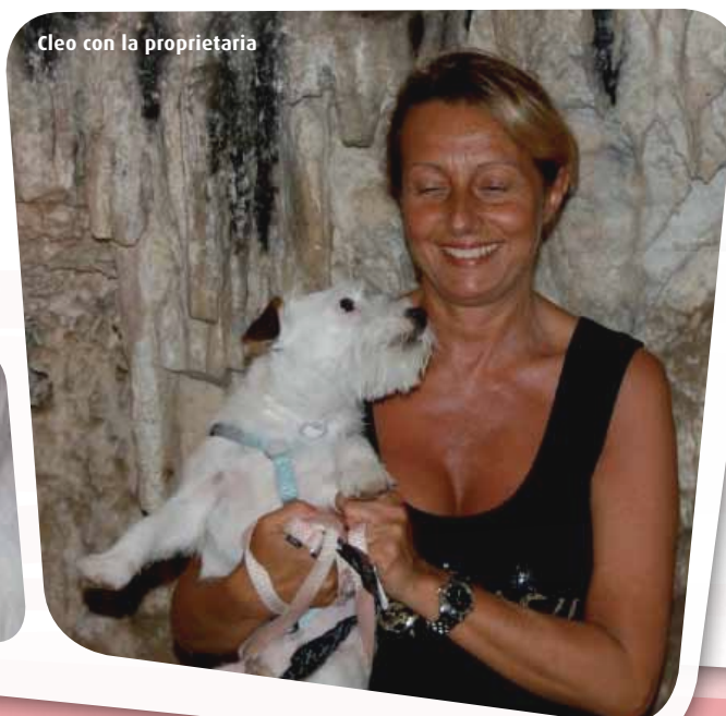
Cleo con la proprietaria