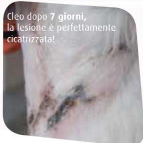
Cleo dopo 7 giorni, la lesione è perfettamente cicatrizzata!