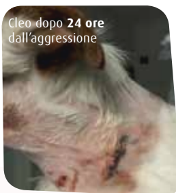
Cleo dopo 24 ore dall'aggressione