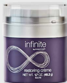
infinite by Forever™ restoring crème

Crema da notte nutriente di alta qualità.