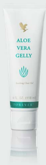
Aloe Vera Gelly