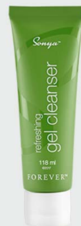
Sonya™ refreshing gel cleanser